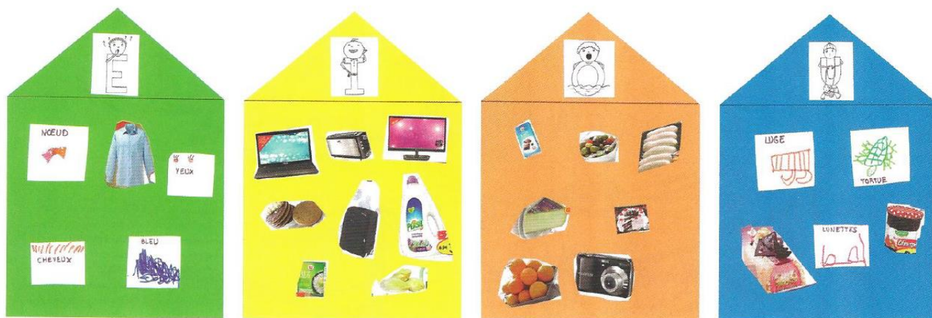
Maisons des phonèmes réalisées par des élèves de Grande Section.