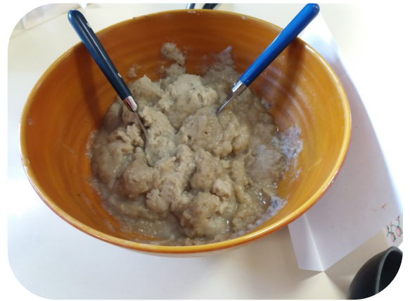
Purée de Topinambours